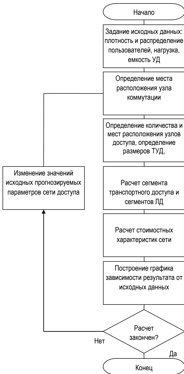
Рис. 3. Схема-алгоритм процедуры расчета характеристик СД